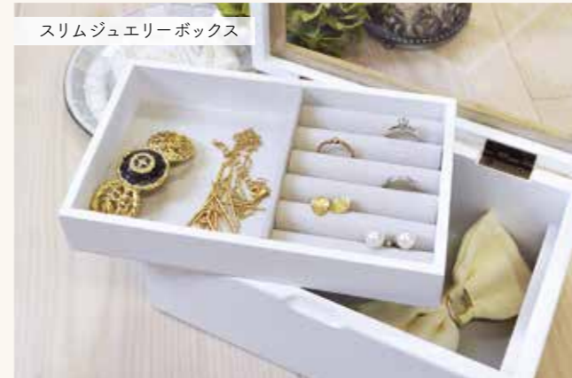
スリムジュエリーボックス

ミア ジュエリーボックス 税抜価格 ¥3,500 Size : W22×D16.5×H5.5cm Material : MDF、木、ガラス Lot : C/20 U/1