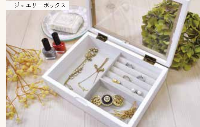
ジュエリーボックス

ミア ウォッチケース 税抜価格 ¥3,300 Size : W16×D10×H7.5cm Material : MDF、木、ガラス Lot : C/18 U/1