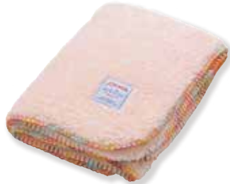
PPK : S 150572 L 150619 LL 150657