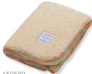
PBE : S 150589 L 150626 LL 150664