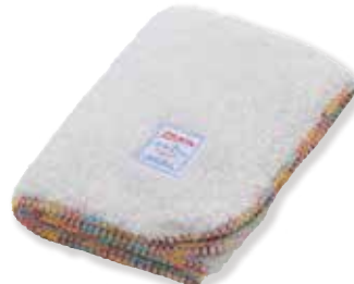
PGY : S 150602 L 150640 LL 150688