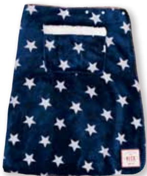
スタ NV 157526 完売しました