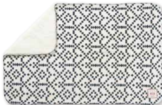
ネイティブWH : S 157496 L 157830