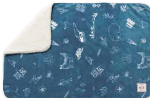
フレークBL : S 157519 L 157854