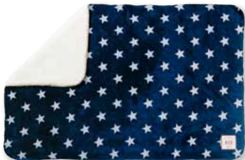
スターNV : S 157465 売れました L 157809 売れました