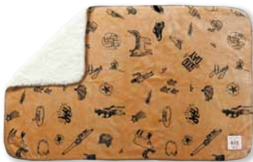
フレークBE : S 157502 L 157847