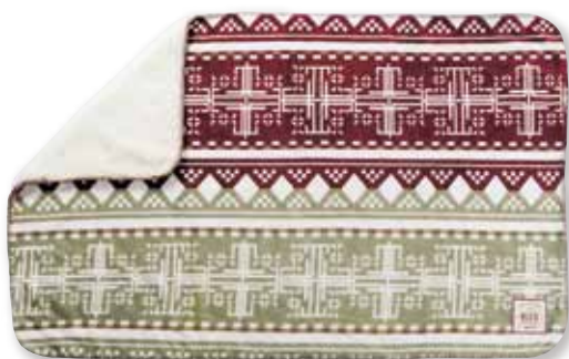
ネイティブRD : S 157489 L 157823