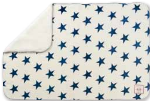
スターWH : S 157472 売れました L 157816 売れました